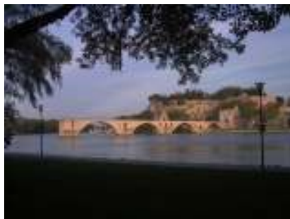
Sure le pont d'Avignon