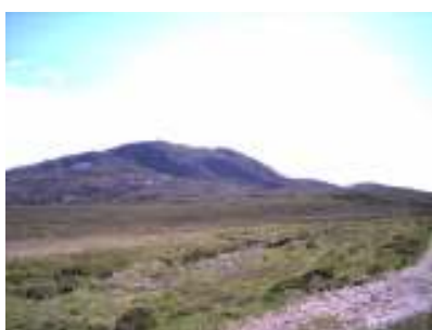
In het noorden van Schotland