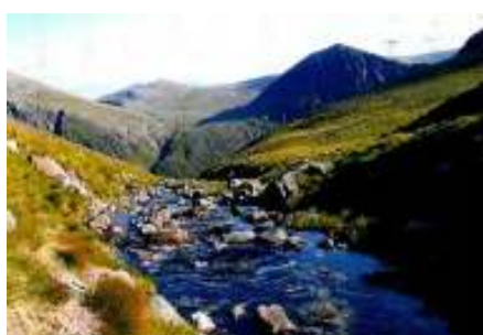
Midden in the Highlands

De prijzen kunnen wijzigen, door veranderingen in ferry, brandstof of andere kosten of de koers van de £. Prijzen voor extra personen of huisdieren op aanvraag.