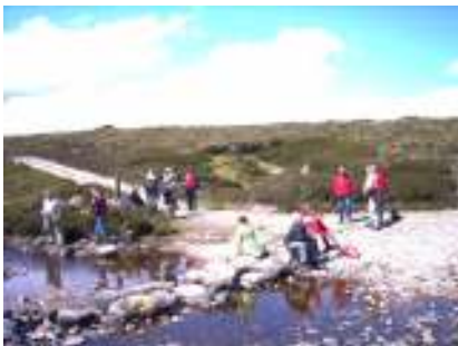
Wandeling in Schotland

Bij aankomst op een camping, hebben wij het nodige geregeld zodat u zich alleen maar hoeft te melden en de pootjes van uw kampeermiddel hoeft uit te draaien en klaar is Kees.