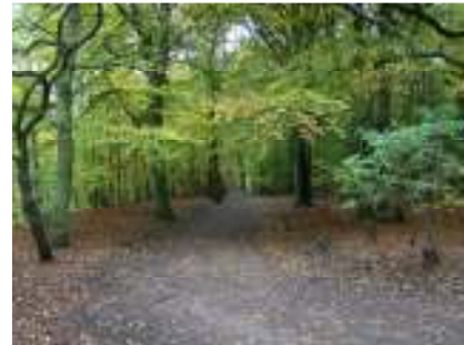
Bossen in de Alsace

De route die u rijdt, doet u in uw eigen tempo. Ziet u onderweg iets dat de moeite waard is om te bekijken, neem uw tijd, want wij vragen u om niet vóór drie uur op de volgende camping te arriveren, maar nog wel voor sluitingstijd. Uw reis is tenslotte ook vakantie en tijd die heeft u, denken wij, ruim genoeg.